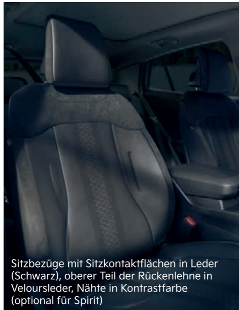
Sitzbezüge mit Sitzkontaktflächen in Leder (Schwarz), oberer Teil der Rückenlehne in Veloursleder, Nähte in Kontrastfarbe (optional für Spirit)