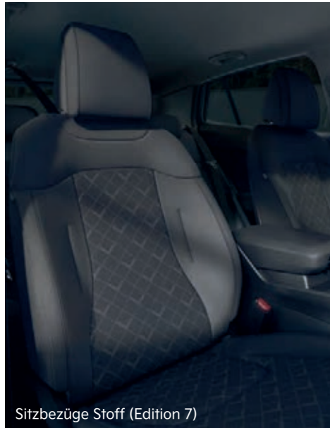
Sitzbezüge Stoff (Edition 7)

Der Innenraum des Kia Sportage besticht durch stilvolle Gestaltung sowie hochwertige Materialien und wurde genau auf deine Bedürfnisse ausgerichtet. Steig ein und überzeuge dich selbst.