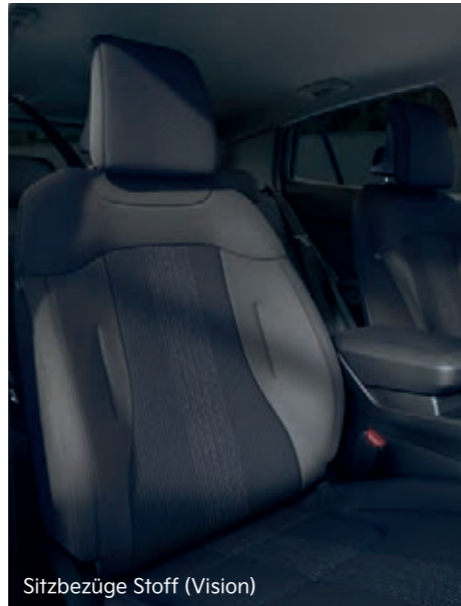
Sitzbezüge Stoff (Vision)