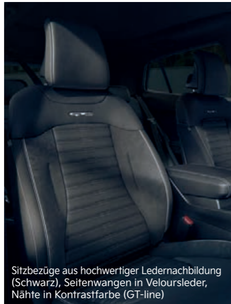
Sitzbezüge aus hochwertiger Ledernachbildung (Schwarz), Seitenwangen in Veloursleder, Nähte in Kontrastfarbe (GT-line)

Abbildungen zeigen kostenpflichtige Sonderausstattung.