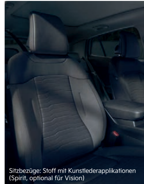
Sitzbezüge: Stoff mit Kunstlederapplikationen (Spirit, optional für Vision)