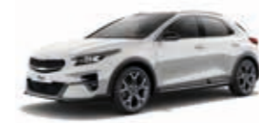
Deluxeweiß Metallic (HW2)