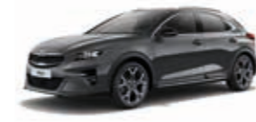
Pentametal Metallic (H8G)