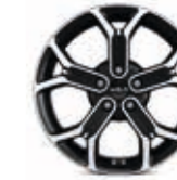
18-Zoll- Leichtmetallfelgen (für Black Xdition)

Bei einigen unserer modernen Metallicfarben werden bewusst unterschiedliche Farbpigmente verwendet. Dadurch können unter bestimmten Lichtverhältnissen, z.B. direktes Sonnenlicht, attraktive Farbeffekte erzielt werden. Zum Teil kann die Farbe changieren, z. B. von Schwarz zu Dunkelblau. Bei den hier abgebildeten Farbdarstellungen kann es aufgrund der Drucktechnik zu Abweichungen zu den Originalfarben kommen. Weitere Informationen zu den Farbeffekten und Grundfarben erhältst du bei deinem Kia-Partner. Metalliclackierungen sind aufpreispflichtig.