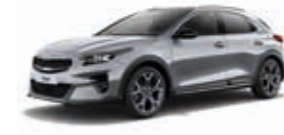
Lunarsilber Metallic (CSS)