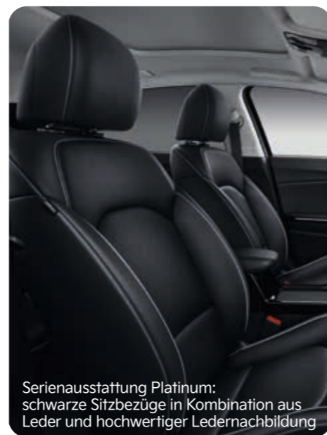
Serienausstattung Platinum: schwarze Sitzbezüge in Kombination aus Leder und hochwertiger Ledernachbildung