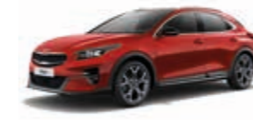
Infrarot Metallic (AA9)