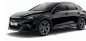
Zilinaschwarz Metallic (1K)