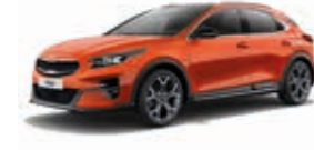
Orange Fusion Metallic (RNG)