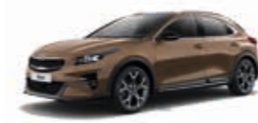
Machined Bronze Metallic (M6Y)