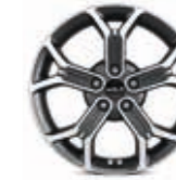
18-Zoll- Leichtmetallfelgen (ab Vision)