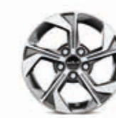
16-Zoll- Leichtmetallfelgen (für Edition 7)