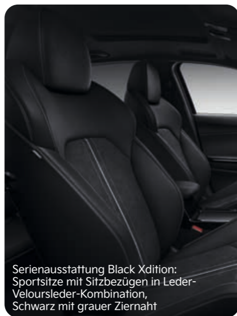
Serienausstattung Black Xdition: Sportsitze mit Sitzbezügen in Leder-Veloursleder-Kombination, Schwarz mit grauer Ziernaht