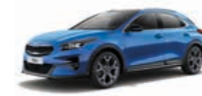
Blue Flame Metallic (B3L)