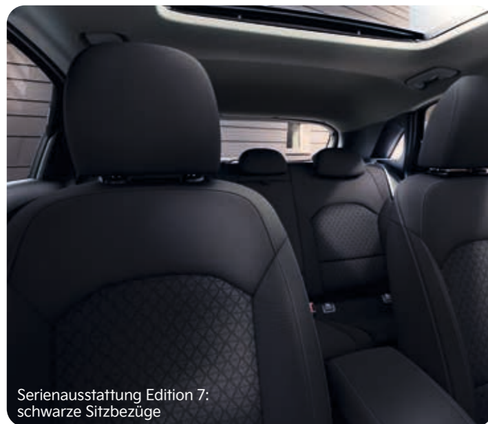
Serienausstattung Edition 7: schwarze Sitzbezüge

Hochwertige Materialien und eine stilvolle Gestaltung sorgen dafür, dass du dich im Kia XCeed rundum wohlfühlen kannst. Für die Sitzbezüge stehen dir Kombinationen aus Stoff oder Leder mit hochwertiger Ledernachbildung zur Wahl. Dem Innenraum der Ausführung Xdition verleihen gelbe Farbakzente und Sitzbezüge mit Wabenmuster ein exklusives Flair, während das Interieur der Black Xdition mit Sportsitzen und Sitzbezügen in einer Leder-Veloursleder-Kombination die Sportgene des XCeed gekonnt in Szene setzt.