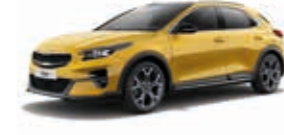
Quantumgelb Metallic (YQM)