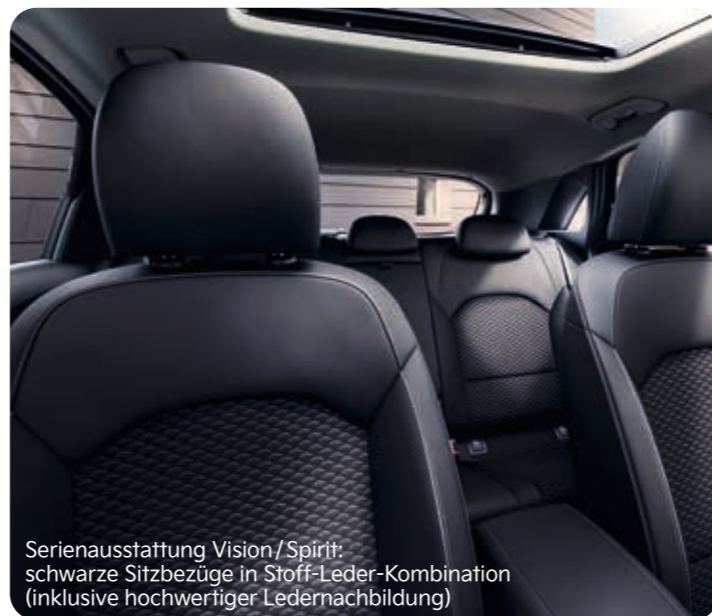
Serienausstattung Vision/Spirit: schwarze Sitzbezüge in Stoff-Leder-Kombination (inklusive hochwertiger Ledernachbildung)