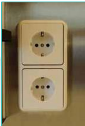
Steckdosen und/oder RJ 45 Datendosen