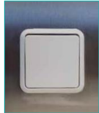
Lichtschalter für Arbeitsplatzbeleuchtung