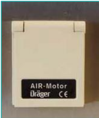
Druckluftentnahme 10 bar mit Rückführung