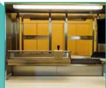
Rollenhalter mit Schneid- vorrichtung in verschie- denen Abmessungen