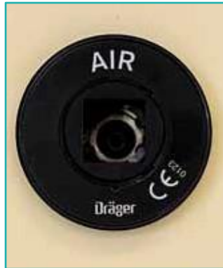
Druckluftentnahme 5 bar