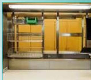
Edelstahl-Drahtkörbe in verschiedenen Größen und Ausführungen