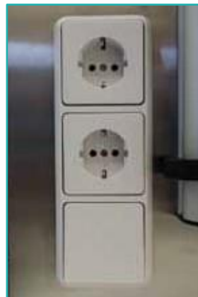
Steckdosen / Licht- schalterkombinationen