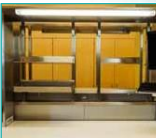
geschlossene Ablagen in verschiedenen Längen und Tiefen