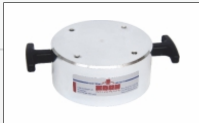
150 mm Lastplatte Erweiterung des Messbereiches (Evd 70-140 MN/m 2 )