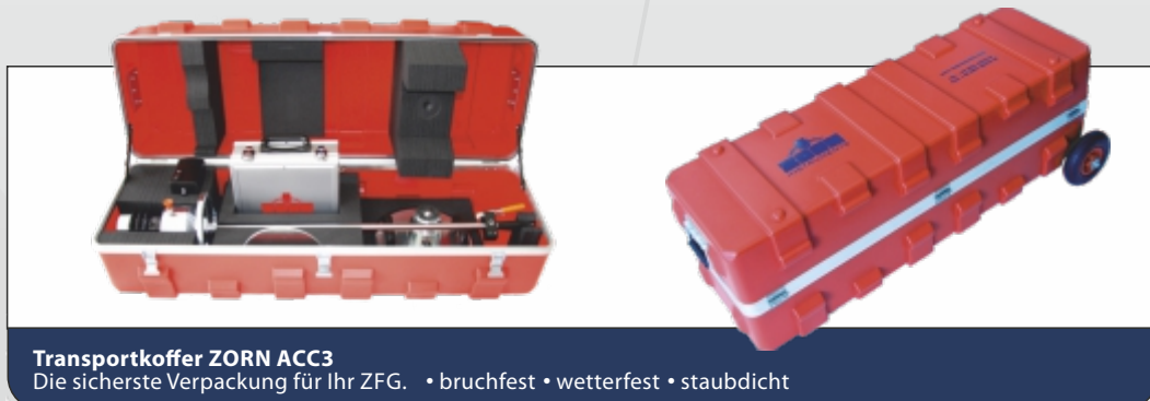
Transportkoffer ZORN ACC3 Die sicherste Verpackung für Ihr ZFG. • bruchfest • wetterfest • staubdicht