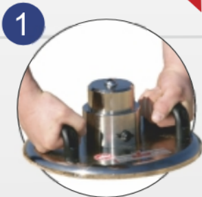
1. Lastplatte auflegen