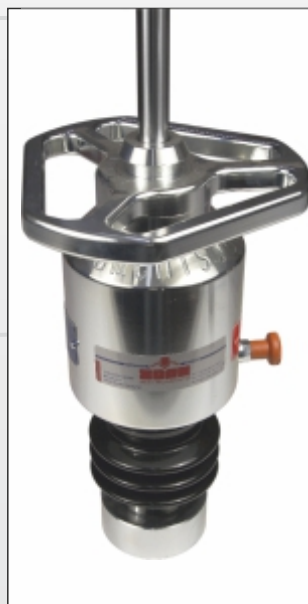
15 kg Belastungsvorrichtung 1,5 fache Stoßbelastung (Evd 70-105 MN/m 2 )