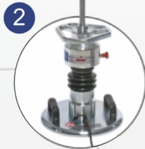
2. Gewicht aufsetzen