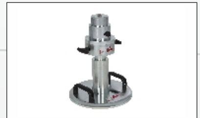
CBR Feldversuch, dynamisch