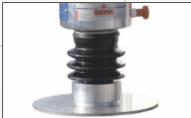
Magnetstandfuß Sauberes Abstellen der Mechanik im Feld während der Ausrichtung der Lastplatte