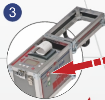
3. Gerät einschalten