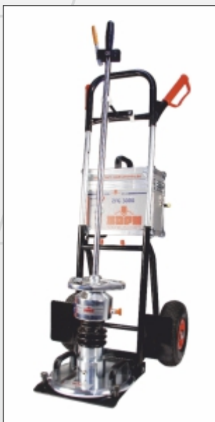
klappbarer Transportwagen Leichter Transport auf jeder Baustelle