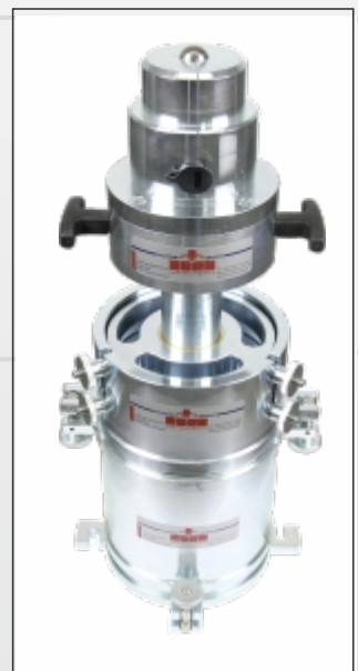
CBR Laborversuch, dynamisch