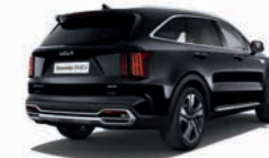
Auroraschwarz Metallic (ABP)

Bei einigen unserer modernen Metallicfarben werden bewusst unterschiedliche Farbpigmente verwendet. Dadurch können unter bestimmten Lichtverhältnissen, z. B. direktes Sonnenlicht, attraktive Farbeffekte erzielt werden. Zum Teil kann die Farbe changieren, z. B. von Schwarz zu Dunkelblau. Bei den hier abgebildeten Farbdarstellungen kann es aufgrund der Drucktechnik zu Abweichungen zu den Originalfarben kommen. Weitere Informationen zu den Farbeffekten und Grundfarben erhältst du bei deinem Kia-Partner. Metalliclackierungen sind aufpreispflichtig.