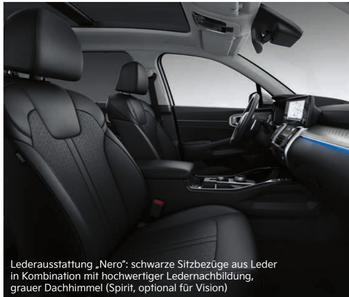
Lederausstattung „Nero“: schwarze Sitzbezüge aus Leder in Kombination mit hochwertiger Ledernachbildung, grauer Dachhimmel (Spirit, optional für Vision)