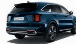
Gravity Blau Metallic (B4U)