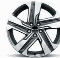
19-Zoll- Leichtmetallfelgen (für Plug-in Hybrid, Spirit Diesel und ab Vision Hybrid)