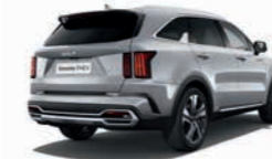
Seidensilber Metallic (4SS)