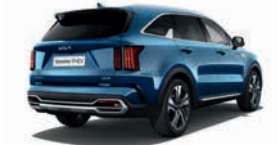
Mineralblau Metallic (M4B)