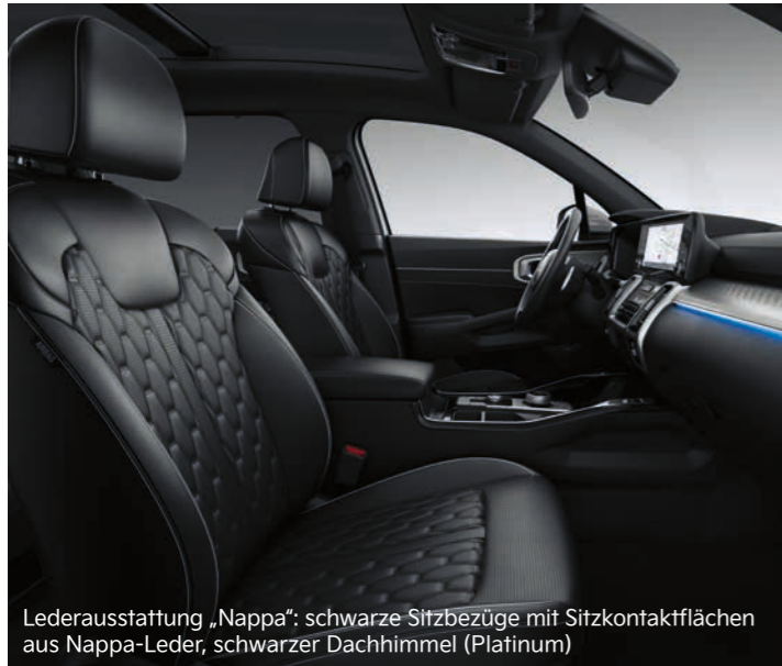
Lederausstattung „Nappa“: schwarze Sitzbezüge mit Sitzkontaktflächen aus Nappa-Leder, schwarzer Dachhimmel (Platinum)

Das elegante und stilvolle Interieur des Kia Sorento wird dich überzeugen. Das Ausstattungsspektrum beinhaltet neben hochwertigen schwarzen Stoffsitzen drei verschiedene Ledervarianten: in Schwarz, zweifarbig in Schwarz-Hellgrau sowie in Schwarz mit Sitzkontaktflächen in Nappa-Leder.