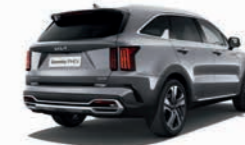
Stahlgrau Metallic (KLG)