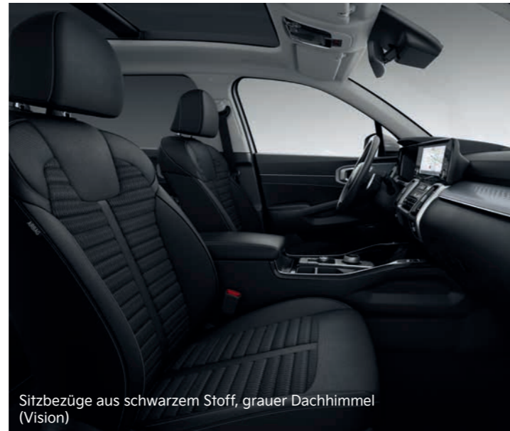
Sitzbezüge aus schwarzem Stoff, grauer Dachhimmel (Vision)

Abbildungen zeigen kostenpflichtige Sonderausstattung. Darstellung: Repräsentation für Sitzkonfiguration.