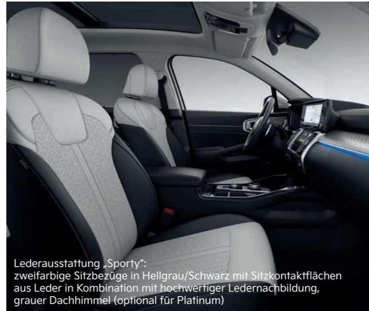
Lederausstattung „Sporty“: zweifarbige Sitzbezüge in Hellgrau/Schwarz mit Sitzkontaktflächen aus Leder in Kombination mit hochwertiger Ledernachbildung, grauer Dachhimmel (optional für Platinum)