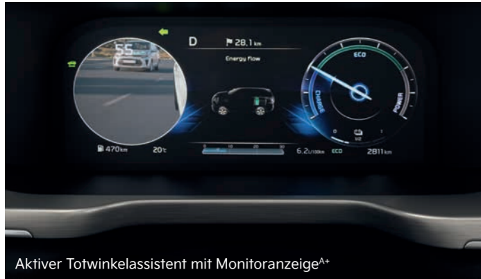
Aktiver Totwinkelassistent mit Monitoranzeige A+

Die modernen, intelligenten Assistenzsysteme helfen, das Fahren im Kia Sorento sicherer und entspannter zu machen.