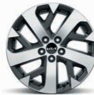
18-Zoll- Leichtmetallfelgen (für Vision Diesel)

Bei einigen unserer modernen Metallicfarben werden bewusst unterschiedliche Farbpigmente verwendet. Dadurch können unter bestimmten Lichtverhältnissen, z. B. direktes Sonnenlicht, attraktive Farbeffekte erzielt werden. Zum Teil kann die Farbe changieren, z. B. von Schwarz zu Dunkelblau. Bei den hier abgebildeten Farbdarstellungen kann es aufgrund der Drucktechnik zu Abweichungen zu den Originalfarben kommen. Weitere Informationen zu den Farbeffekten und Grundfarben erhältst du bei deinem Kia-Partner. Metalliclackierungen sind aufpreispflichtig.