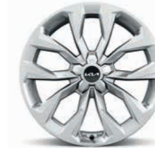
20-Zoll- Leichtmetallfelgen (für Platinum Diesel)

Detaillierte Informationen zum Kia Sorento findest du unter www.kia.com/de/broschuere . Dort kannst du dir auch die komplette Modellbroschüre herunterladen.