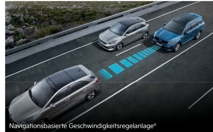
Navigationsbasierte Geschwindigkeitsregelanlage A

Der serienmäßige intelligente Geschwindigkeitsassistent (Intelligent Speed Limit Assist, ISLA) erkennt ein ausgeschildertes Tempolimit per Kamera, zeigt es in der Instrumenteneinheit und auf dem Navigationsbildschirm + an und bietet zudem die Möglichkeit, es automatisch in die Geschwindigkeitsregelanlage zu übernehmen.