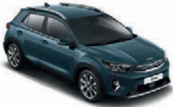
Denimblau Met. (EU3)