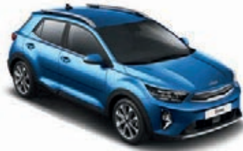
Bathysblau Met. (SPB)