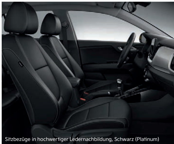
Sitzbezüge in hochwertiger Ledernachbildung, Schwarz (Platinum)