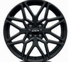
17-Zoll-Leichtmetallfelgen (Nightline Edition)