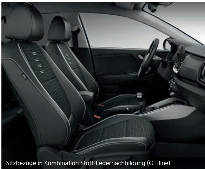
Sitzbezüge in Kombination Stoff-Ledernachbildung (GT-line)