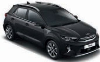
Auroraschwarz Met. (ABP)