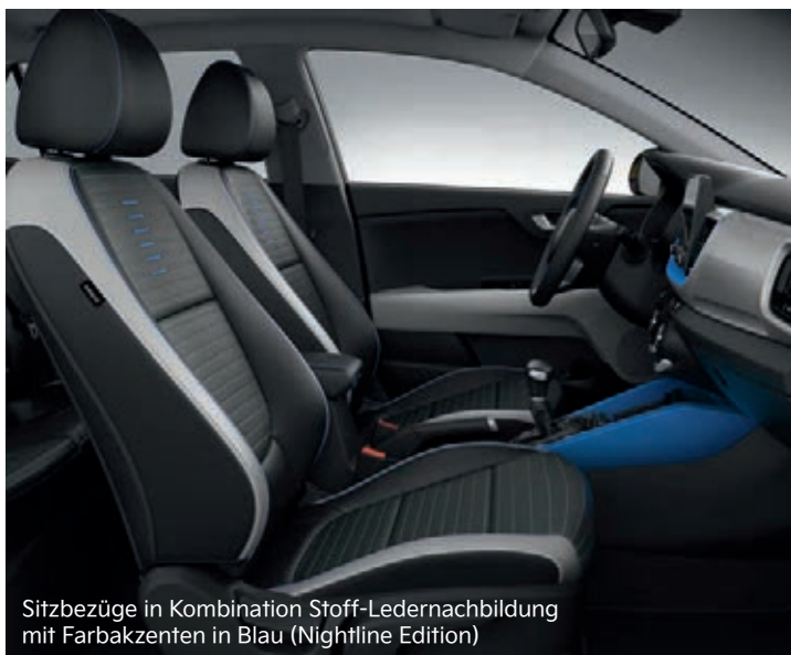
Sitzbezüge in Kombination Stoff-Ledernachbildung mit Farbakzenten in Blau (Nightline Edition)