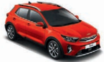
Signalrot Met. (BEG)