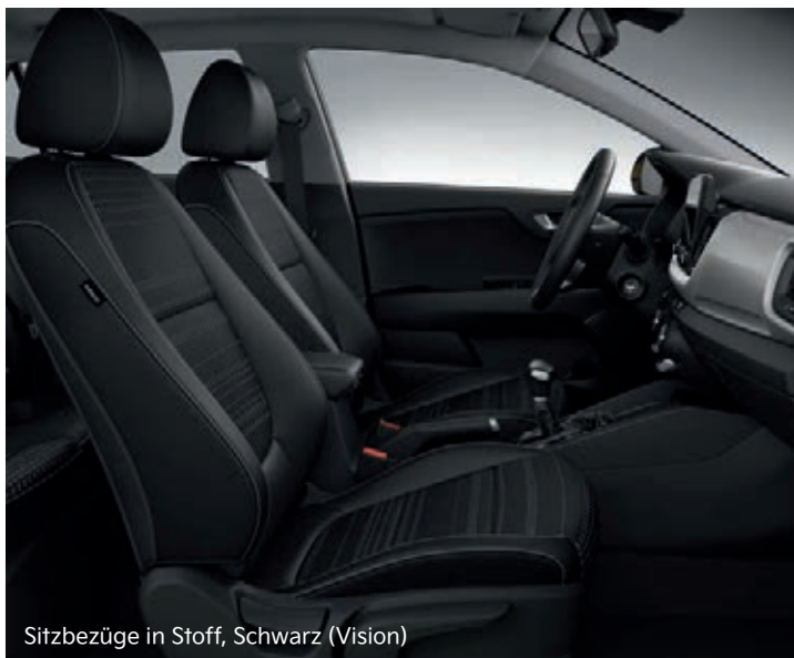
Sitzbezüge in Stoff, Schwarz (Vision)

Hier kannst du dich entspannen: Für den Kia Stonic stehen Sitzbezüge aus Stoff oder Stoff in Kombination mit Ledernachbildung zur Wahl. Die Version Platinum bietet dir Sitze aus hochwertiger Ledernachbildung.