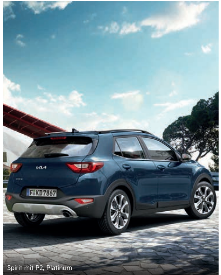
Spirit mit P2, Platinum