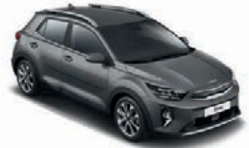
Astrograu Met. (M7G)