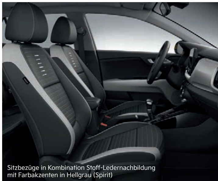
Sitzbezüge in Kombination Stoff-Ledernachbildung mit Farbakzenten in Hellgrau (Spirit)