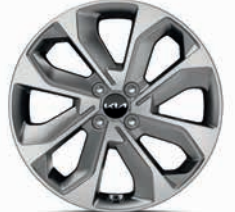
17-Zoll-Leichtmetallfelgen (Spirit und Platinum)