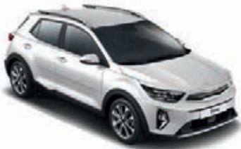
Snow White Pearl (SWP)

Bei einigen unserer modernen Metallicfarben werden bewusst unterschiedliche Farbpigmente verwendet. Dadurch können unter bestimmten Lichtverhältnissen, z. B. direktes Sonnenlicht, attraktive Farbeffekte erzielt werden. Zum Teil kann die Farbe changieren, z. B. von Schwarz zu Dunkelblau. Bei den hier abgebildeten Farbdarstellungen kann es aufgrund der Drucktechnik zu Abweichungen zu den Originalfarben kommen. Weitere Informationen zu den Farbeffekten und Grundfarben erhältst du bei deinem Kia-Partner. Metalliclackierungen sind aufpreispflichtig.