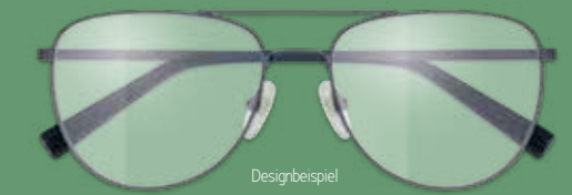
Designbeispiel S.OLIVER ARBEITSPLATZBRILLE 299€*

ARBEITSPLATZBRILLE inkl. Gläser* ab 299€