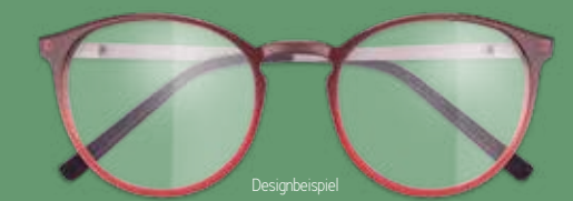
Designbeispiel MORE & MORE ARBEITSPLATZBRILLE 299€*

Kommen Sie einfach vorbei. Wir beraten Sie gerne!