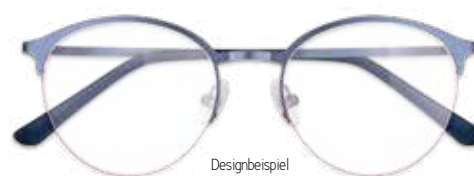
Designbeispiel DEEJAYS EYEWEAR ARBEITSPLATZBRILLE 299€*