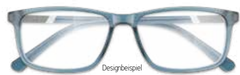
Designbeispiel EMIL K. ARBEITSPLATZBRILLE 299€*

ARBEITSPLATZBRILLE inkl. Gläser* ab 299€