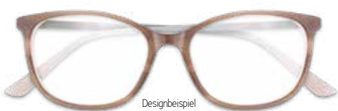
Designbeispiel EMIL K. ARBEITSPLATZBRILLE 299€*