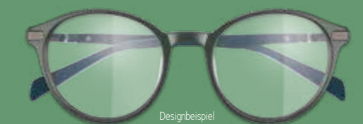
Designbeispiel MORE & MORE ARBEITSPLATZBRILLE 299€*