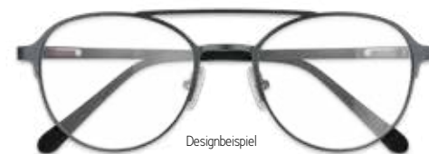
Designbeispiel DEEJAYS EYEWEAR ARBEITSPLATZBRILLE 299€*