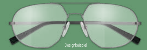
Designbeispiel S.OLIVER ARBEITSPLATZBRILLE 299€*