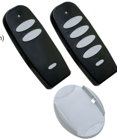
RCR 11-2 / RCR 11-4