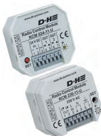
RCM 24-11-U / RCM 230-11-U